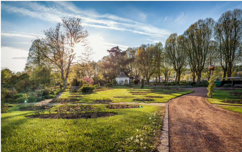
Rosengarten in Zweibrücken (2014).