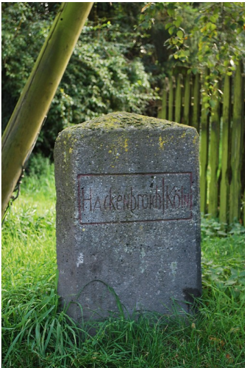
Grenzstein Hackenbroich Köln (2014)