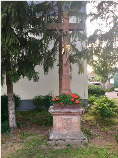
Flurkreuz an der Seniorenanlage in Maikammer (2017)