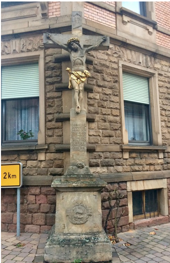
Flurkreuz am oberen Kreuz in Maikammer (2017)