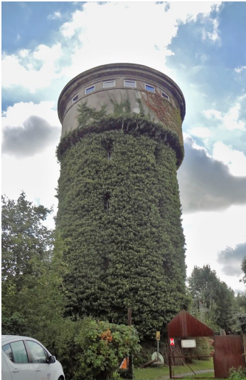
Ehemaliger Wasserturm in Geldern (2017)