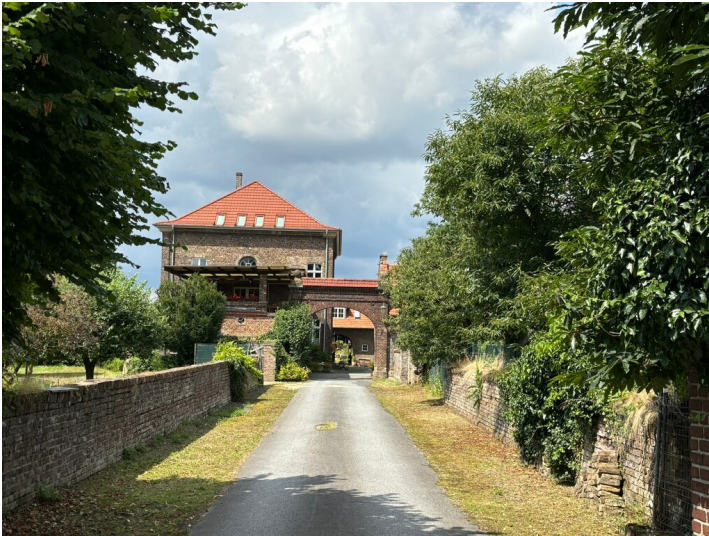
Neu-Subbelrather Hof in Widdersdorf (2024)