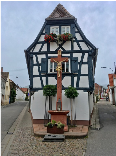
Flurkreuz auf dem Weyhergässel in Maikammer (2017)