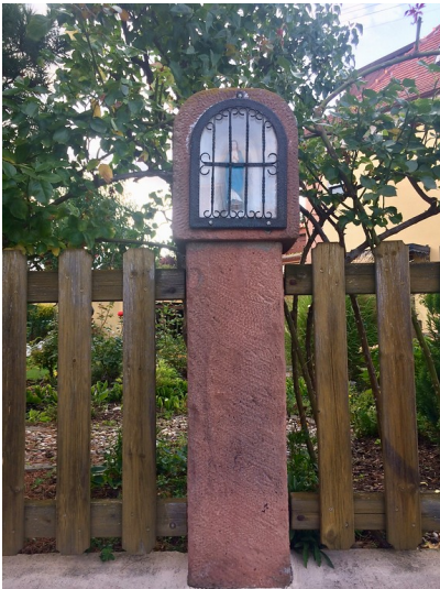
Gesamtansicht des Bildstocks in der unteren Sau in Maikammer (2017).