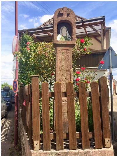
Gesamtansicht des Bildstocks in der oberen Sau in Maikammer (2017).