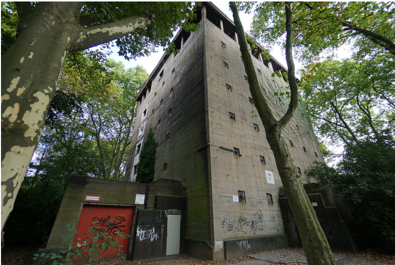
Hochbunker an der Obermarxloher Straße, Duisburg-Neumühl (2017)