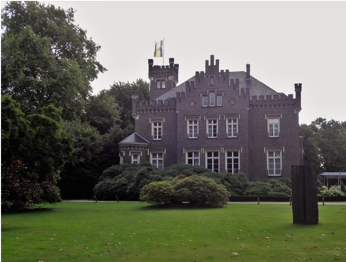
Villa von Eerde in Geldern (2017)