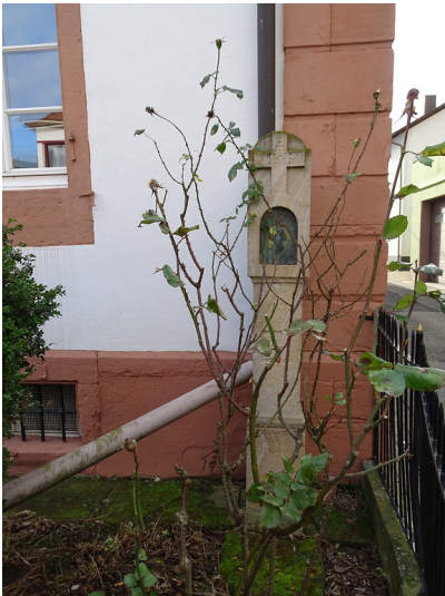
Bildstock im Eizum, Ecke Hartmannstraße - Mühlstraße im Ortsteil Alsterweiler der Ortsgemeinde Maikammer (2018).