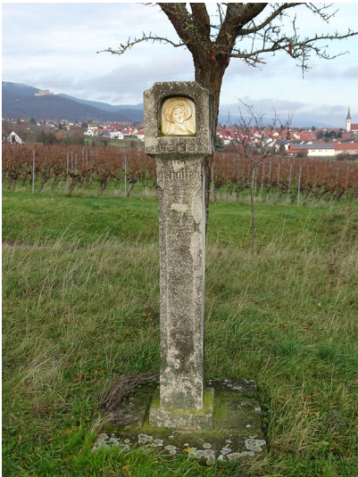
Bildstock im Heiligenberg (2019)