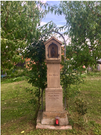
Vorderansicht des Bildstocks in der Gewanne "im oberen Erb" in Maikammer (2017).