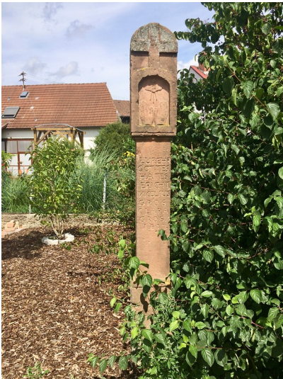
Bildstock auf den Heldwiesen am Beginn des Alsterweilerer Kapellenwegs in Maikammer (2017)