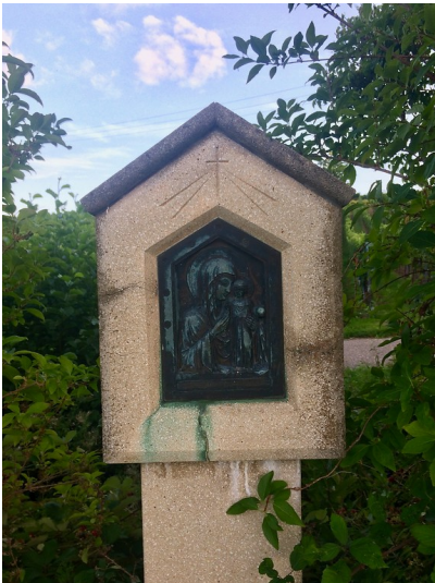
Detailansicht des Bildstocks zwischen den Wegen (2017).