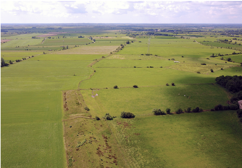
Luftbildaufnahme (Drohne) des Krummwalls (Danewerk) (2017)