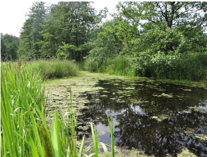
Naturschutzgebiet Fleuthbende bei Kevelaer-Winnekenonk (2014)