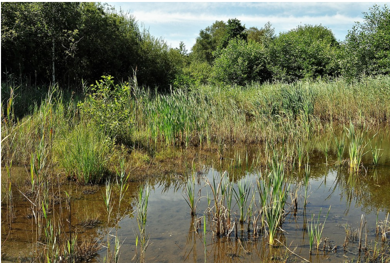
Naturschutzgebiet Hangmoor Damerbruch in Straelen (2014)