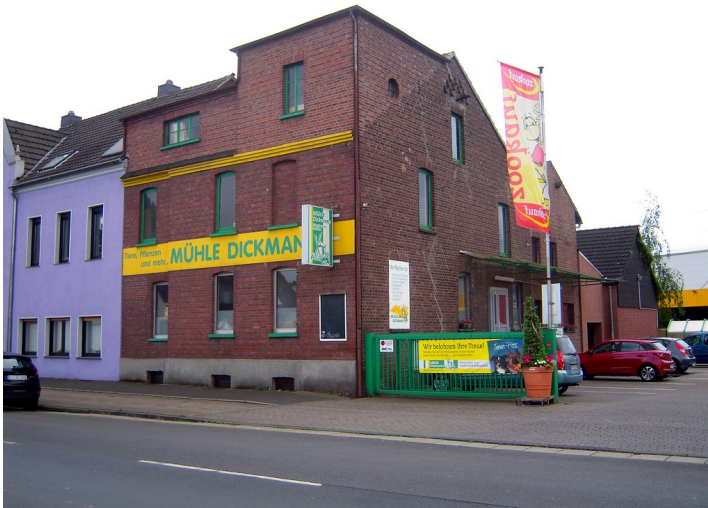
Mühlengebäude der Dickmanns Mühle in Oberhausen (2016), Frontansicht.