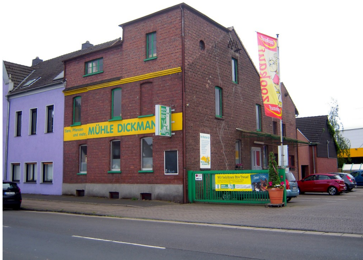
Mühlengebäude der Dickmanns Mühle in Oberhausen (2016), Frontansicht.