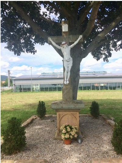
Flurkreuz am Leimenweg in Maikammer (2017)