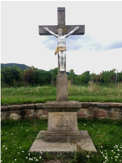
Flurkreuz im Vogelsang in Maikammer (2017)