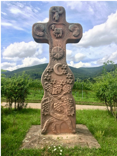
Flurkreuz "Christus in der Kelter" auf dem mittel Held in Maikammer (2017)