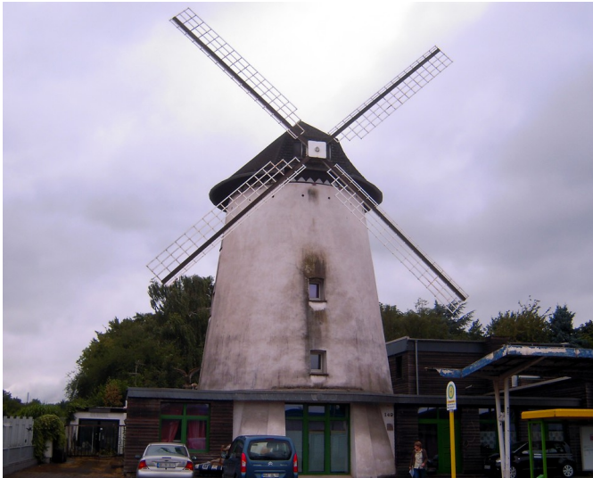
Brahmsche Mühle in Oberhausen-Holten (2016), Frontansicht.