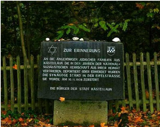
Erinnerungs- und Gedenkstein an die Kastellauner jüdische Gemeinde und die 1938 zerstörte Synagoge auf dem jüdischen Friedhof Kastellaun (2008)