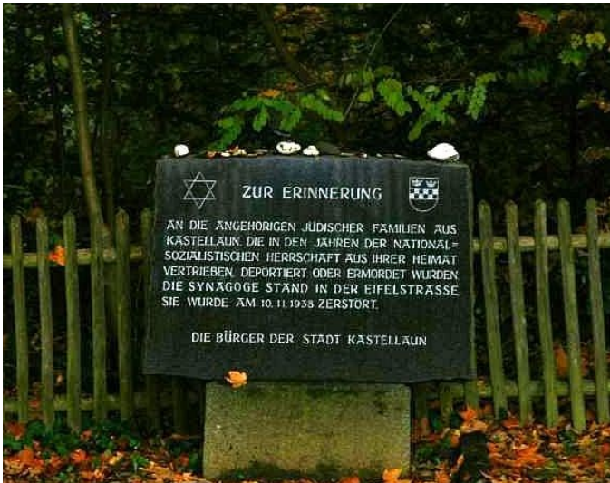
Erinnerungs- und Gedenkstein an die Kastellauner jüdische Gemeinde und die 1938 zerstörte Synagoge auf dem jüdischen Friedhof Kastellaun (2008)