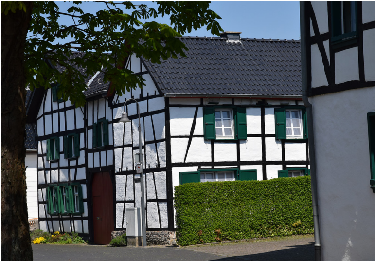
Fachwerkhäuser in Schleiden-Olef (2017).