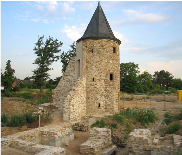
Die Obere Burg in Kuchenheim, Eckturm. Im Vordergrund Fundamente der Brückenpfeiler (2017).