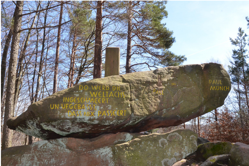
Landmarke und Vermessungspunkt "Pfälzer Weltachs" bei Waldleiningen (2013). Erkennbar ist die Inschrift mit einem Auszug aus dem Gedicht von Paul Münch.