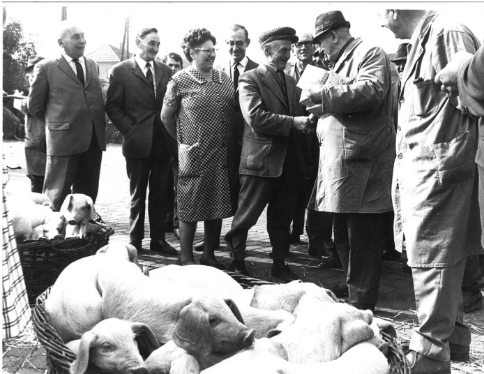
Schweinemarkt in Sonsbeck (1950er)