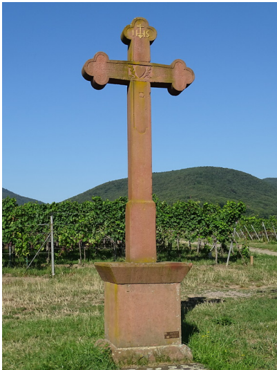
Flurkreuz Rotes Kreuz im vorderen Wolfsloch (2019)