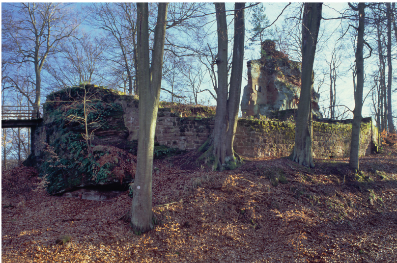
Burgruine Beilstein bei Kaiserslautern, Gesamtansicht der Hauptburg von Norden (2017).