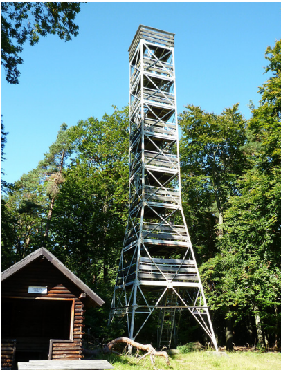
Blick auf den Eybergturm auf dem Großen Eyberg bei Dahn in der Südwestpfalz (2010).