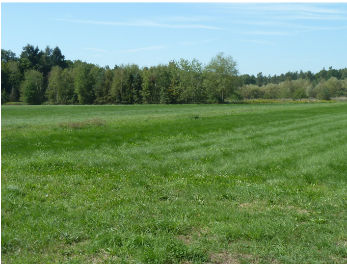
Blick auf den Bienwaldrand bei Schaidt (2017)