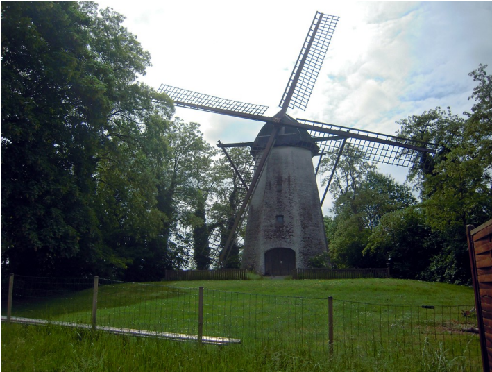
Lohmanns Mühle in Duisburg-Baerl (2016); die Windmühle steht erhöht auf einem Erdhügel.