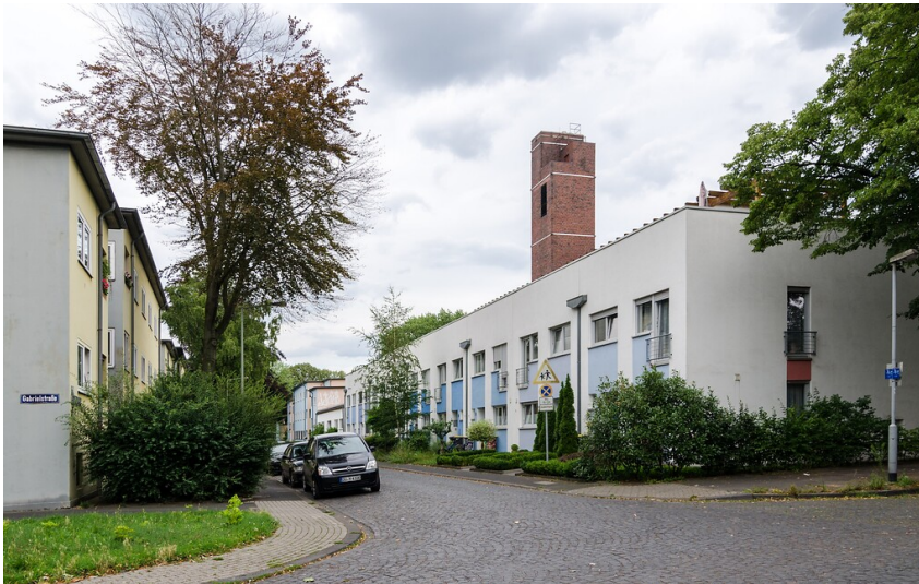
Einschornstein-Siedlung in Duisburg-Neudorf (2015)