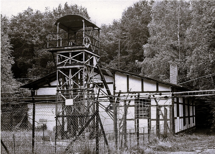
Der Förderergerüst am Franziskaschacht auf dem Lüderich (1978)