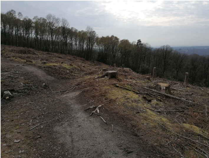
Der Ringwall bei der Grube Lüderich in Rösrath (2021).