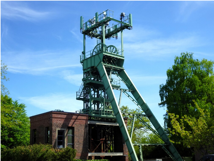
Der Förderturm der Grube Lüderich (2025).