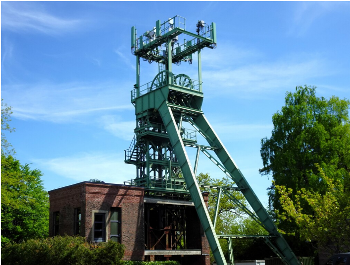
Der Förderturm der Grube Lüderich (2025).