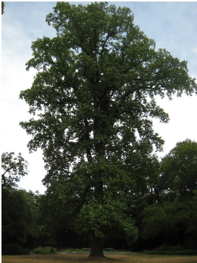
Naturdenkmal Tulpenbaum im Goethepark der Stadt Landau in der Pfalz (2017)