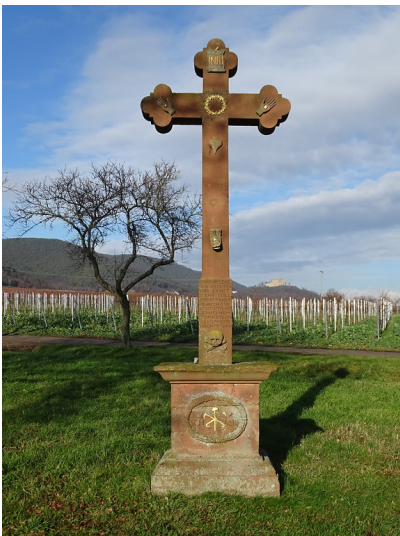
Flurkreuz Fünfwundenkreuz im Ackerbrückenweg (2019)