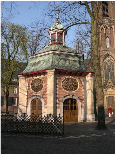
Gnadenkapelle in Kevelaer (2009)