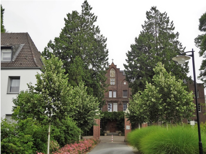
Zwei Riesenlebensbäume in der Parkanlage von St. Bernardin (2017)