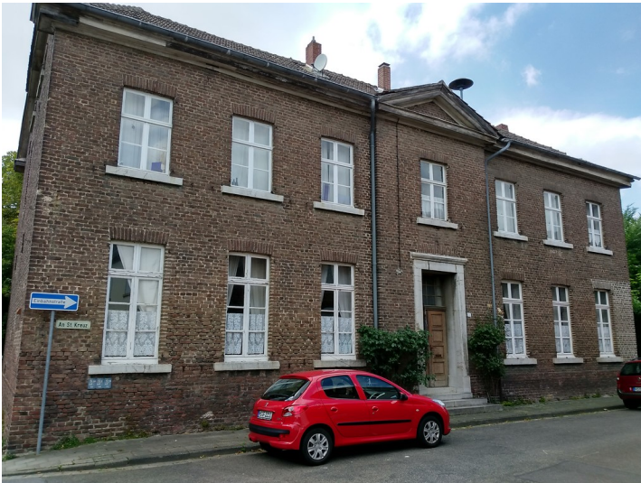
Alte Schule in Keyenberg (2017)