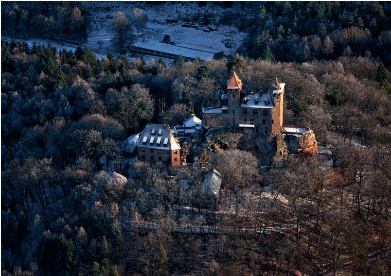
Burg Berwartstein im Winter (2012)