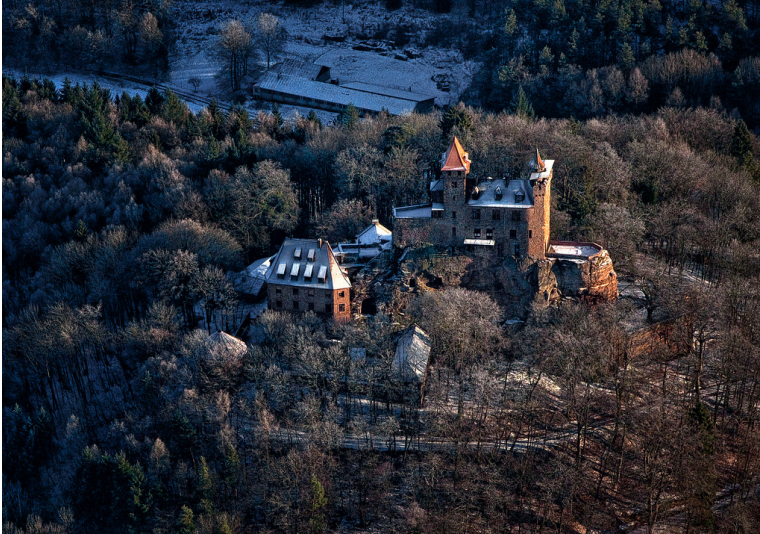
Burg Berwartstein im Winter (2012)