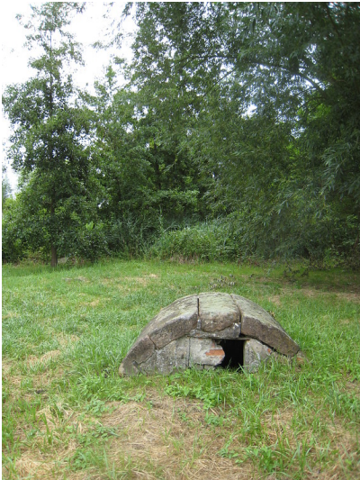
Naturdenkmal Kindelbrunnen in Godramstein (2017)