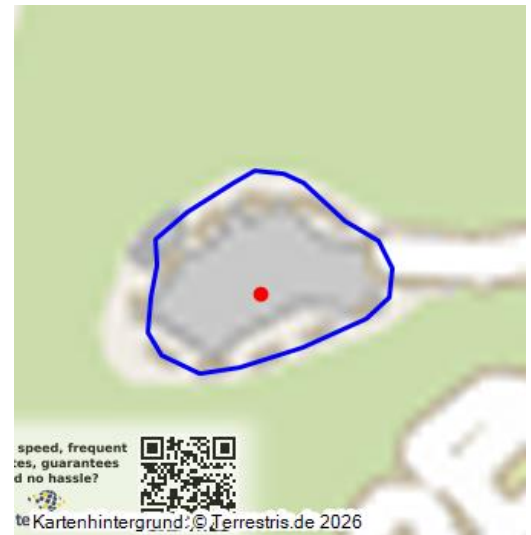
Die Burgruine Nanstein bei Landstuhl - ein virtueller Rundgang (2024)

Die Ruine der mittelalterlichen Burg Nanstein ist eine der bekanntesten und bedeutendsten Burgen der Pfalz. Sie stammt aus dem 12. Jahrhundert und erlangte vor allem wegen ihres prägendsten Burgherrn Franz von Sickingen Berühmtheit. Sie liegt oberhalb auf einem Bergsporn bei Landstuhl und weist typische Merkmale der Pfälzer Felsenburgen auf. Zu diesem Objekt gibt es einen interaktiven 360-Grad-Rundgang .