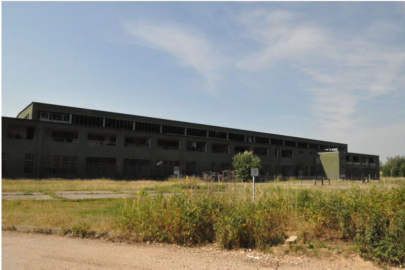
Hangar 7 RAF Wildenrath (2017)